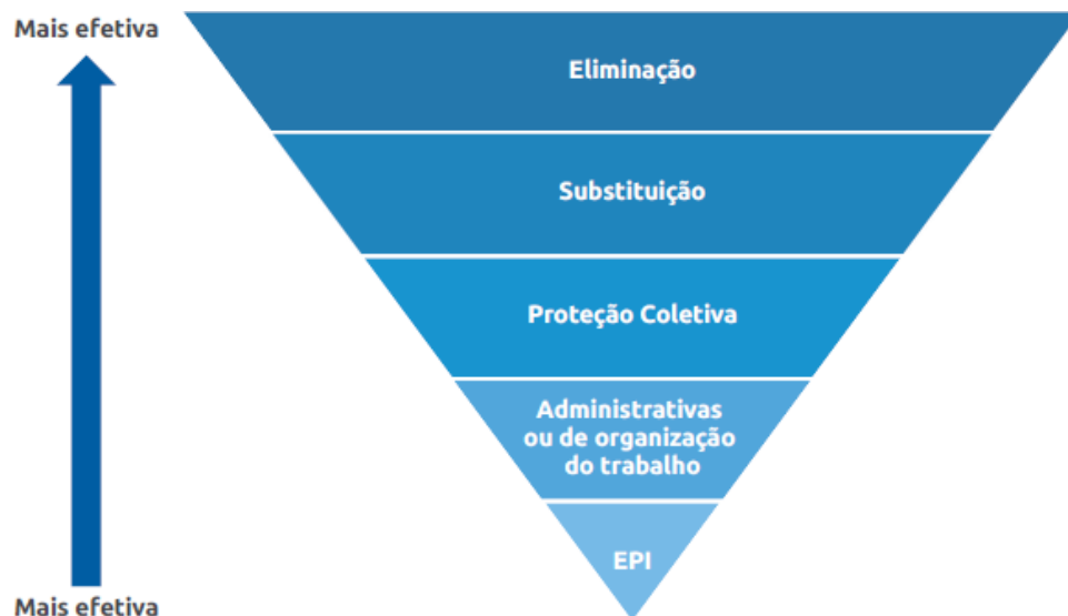
FIGURA 4 - ESTRATÉGIA DE ELIMINAÇÃO DOS RISCOS

Selecionar a opção mais adequada para tratamento do risco requer o conhecimento dos potenciais benefícios, relacionados ao alcance dos objetivos, considerando os custos, esforço ou desvantagens da implementação. As opções de tratamento de riscos não são necessariamente mutuamente exclusivas ou apropriadas em todas as circunstâncias. As opções para tratar o risco podem envolver um ou mais dos seguintes: