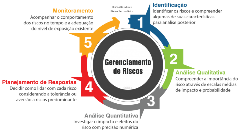
FIGURA 2 - CICLO DO GERENCIAMENTO DE RISCO

A eficácia da gestão de riscos dependerá da sua tomada de decisão com envolvimento das partes interessadas, em particular da Alta Direção.