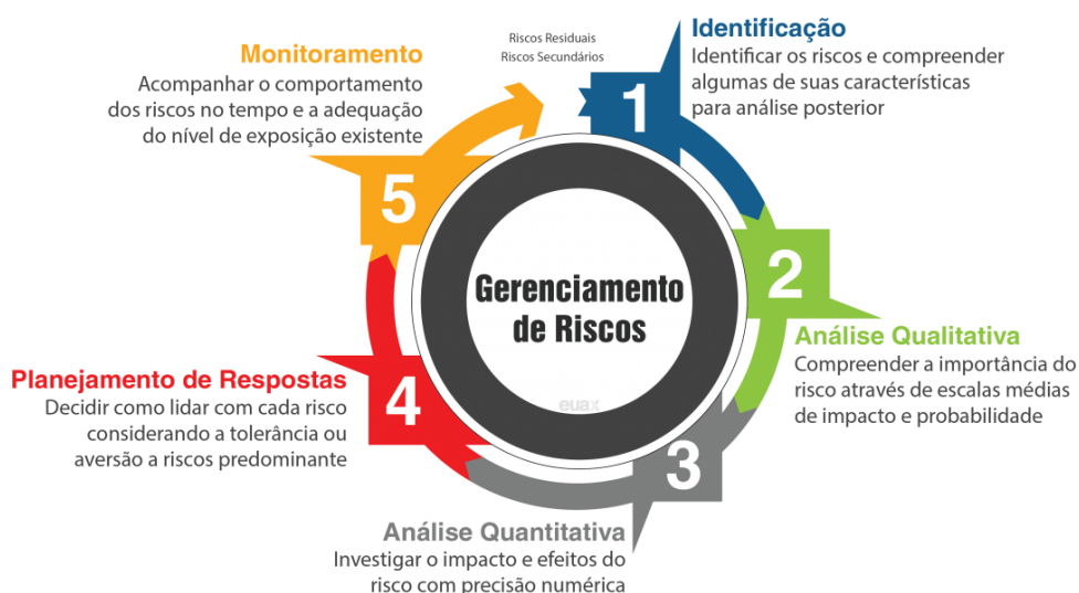
FIGURA 2 - CICLO DO GERENCIAMENTO DE RISCO

A eficácia da gestão de riscos dependerá da sua tomada de decisão com envolvimento das partes interessadas, em particular da Alta Direção.