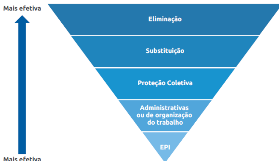
FIGURA 4 - ESTRATÉGIA DE ELIMINAÇÃO DOS RISCOS