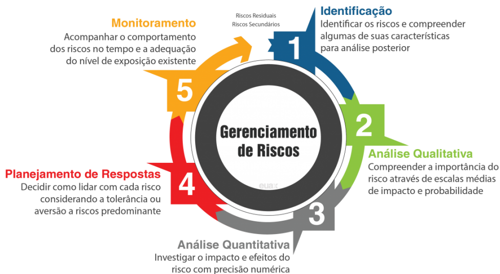
FIGURA 2 - CICLO DO GERENCIAMENTO DE RISCO

A eficácia da gestão de riscos dependerá da sua tomada de decisão com envolvimento das partes interessadas, em particular da Alta Direção.