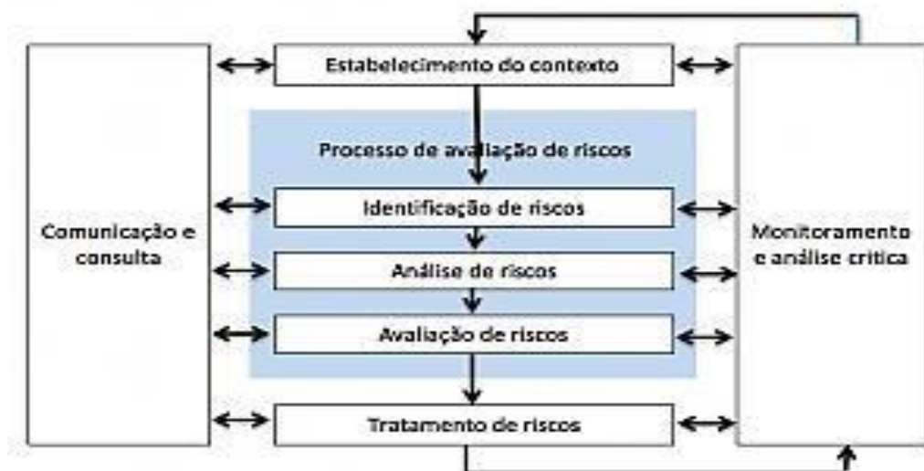
FIGURA 6 - CONTEXTO DA ORGANIZAÇÃO PARA GESTÃO DE RISCO