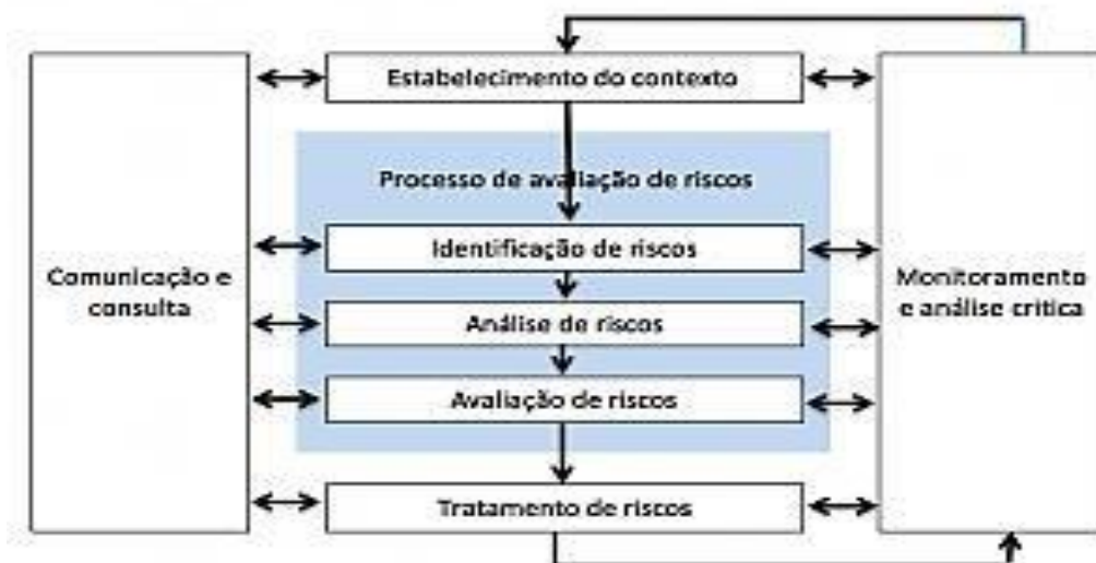
FIGURA 6 - CONTEXTO DA ORGANIZAÇÃO PARA GESTÃO DE RISCO