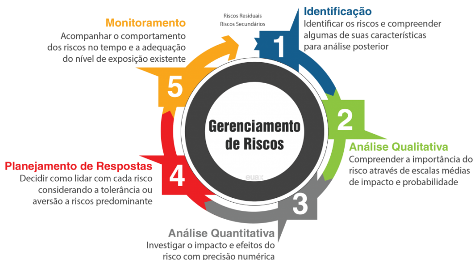
FIGURA 2 - CICLO DO GERENCIAMENTO DE RISCO

A eficácia da gestão de riscos dependerá da sua tomada de decisão com envolvimento das partes interessadas, em particular da Alta Direção.