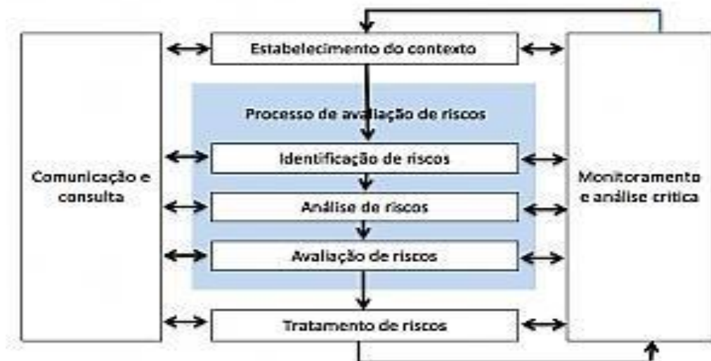
FIGURA 6 - CONTEXTO DA ORGANIZAÇÃO PARA GESTÃO DE RISCO