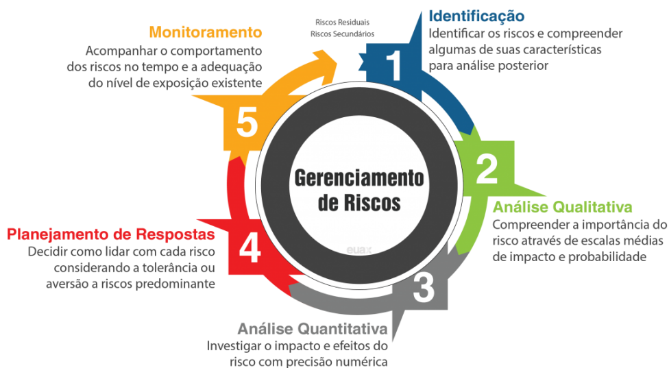
FIGURA 2 - CICLO DO GERENCIAMENTO DE RISCO

A eficácia da gestão de riscos dependerá da sua tomada de decisão com envolvimento das partes interessadas, em particular da Alta Direção.